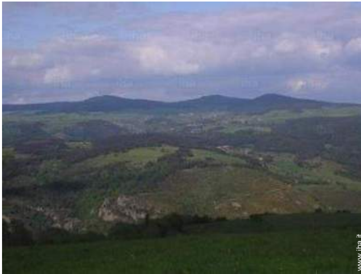
vista dalla casa