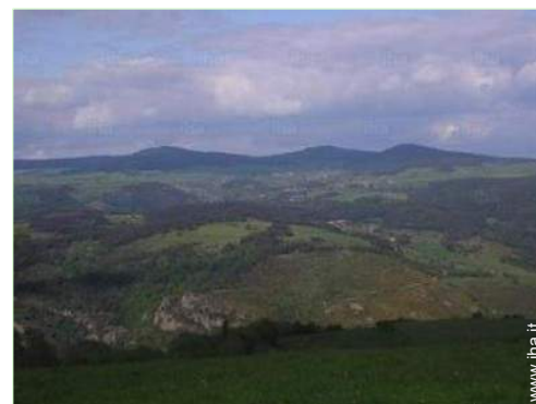
vista dalla casa

Barbecue, tavolo da giardino, sedia(e) da giardino