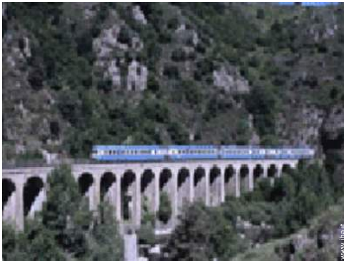
attrezzature ricreative nelle vicinanze