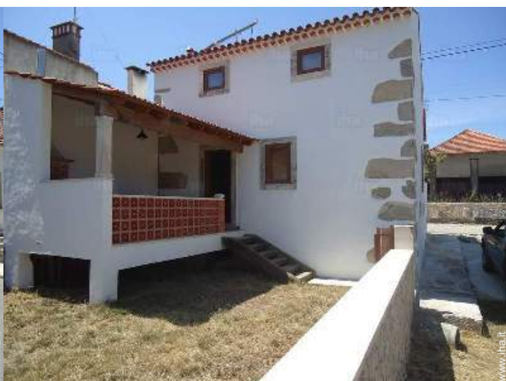
Casa di Villaggio