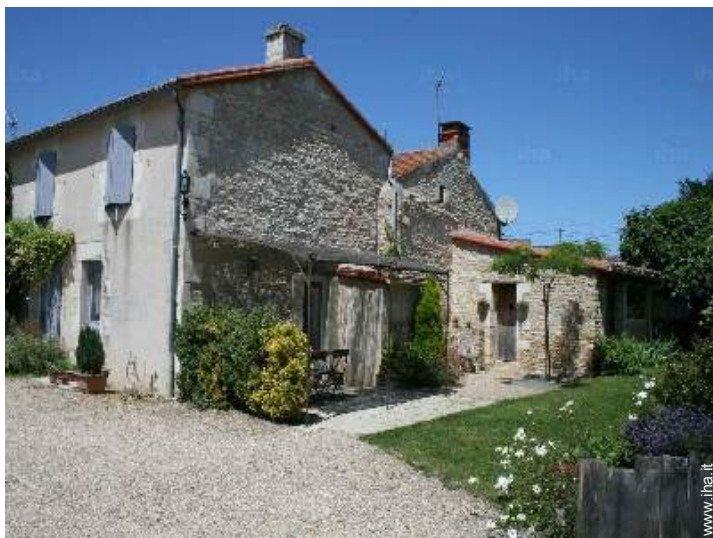
Installazione esterna a disposizione degli ospiti