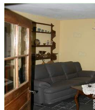
salone con televisore

Villaggio centro 200m Noleggio biciclette/mountain bike 3km Panetteria 3km Negozi tipici 3km Supermercato 3km Banca 3km Farmacia 3km Medico 500m Ospedale 15km