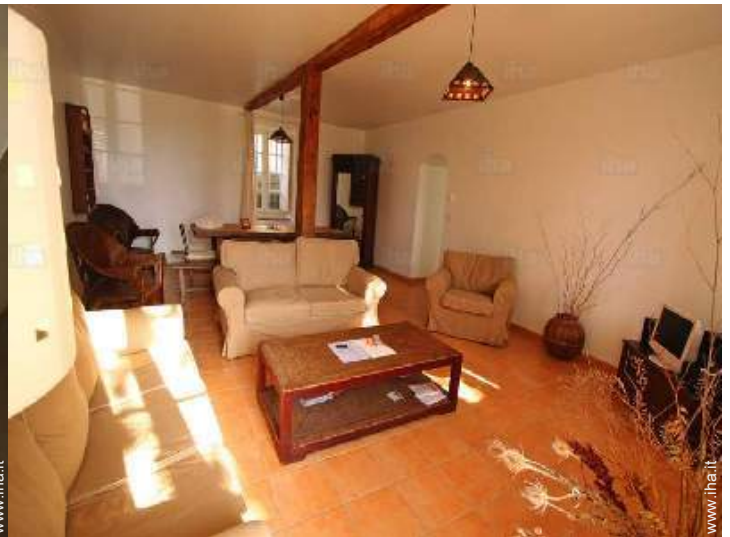
salone con televisore