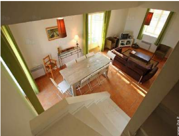
salone con televisore