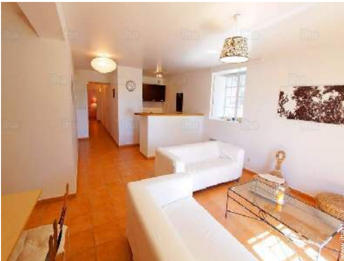
salone con televisore