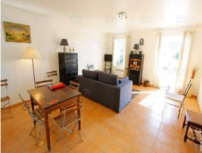
salone con televisore