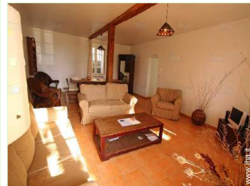
salone con televisore

Mare/oceano 50km Spiaggia 50km Piscina pubblica 5km Campo da tennis pubblico 5km Percorso di golf 18 buche 10km Lago 10km Massiccio montuoso 50km