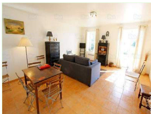
salone con televisore

Bambini benvenuti Animali ammessi Copertura telefonia mobile Acqua : calda/fredda Tensione elettrica : 110-120V / 60Hz Alimentazione elettrica : conduttura