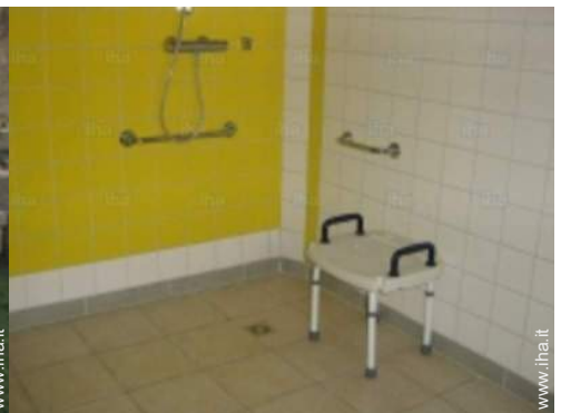
Disposizione interna e comfort