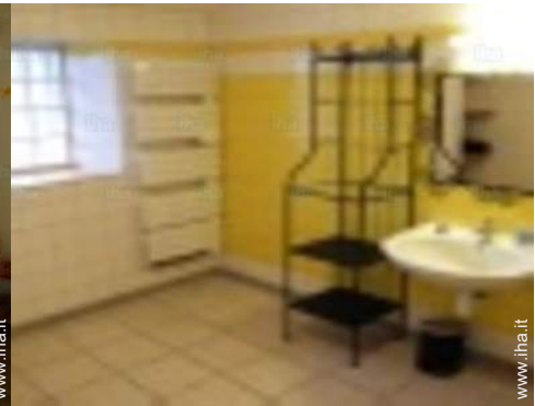
Disposizione interna e comfort