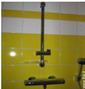
Disposizione interna e comfort