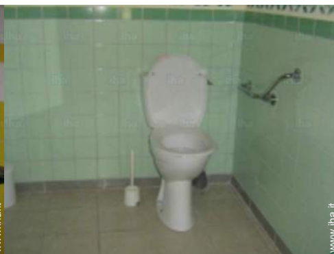
Disposizione interna e comfort