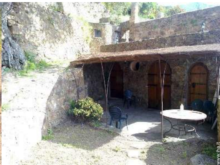
Casa in Pietra