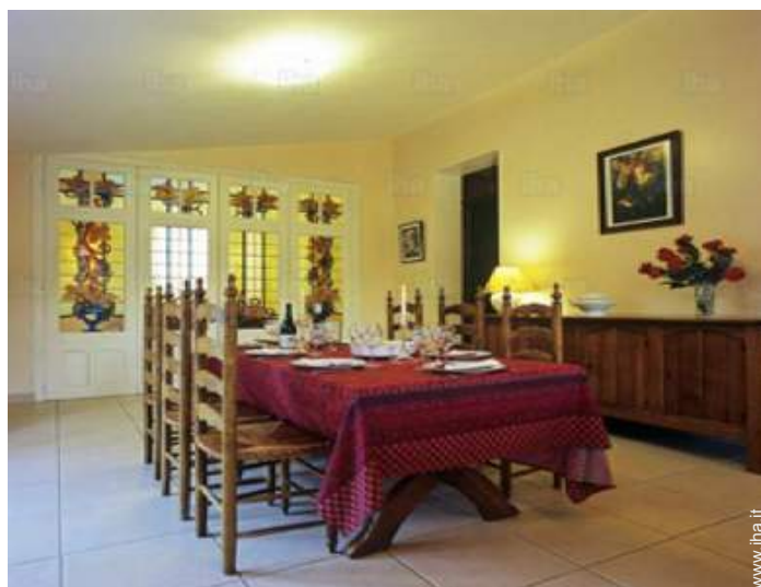
vista dalla sala da pranzo