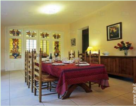
vista dalla sala da pranzo