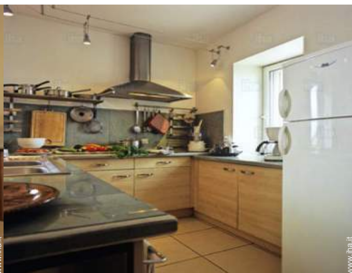
vista dalla cucina