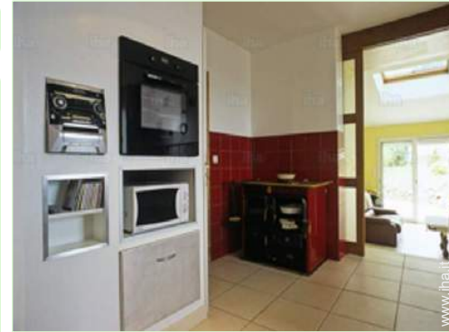
vista dalla cucina

Barbecue, tavolo da giardino, 20 sedia(e) da giardino, ombrellone, altalena