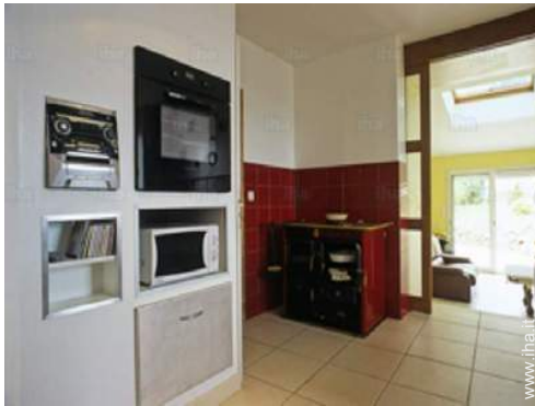
vista dalla cucina