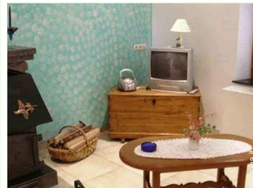
vista dal salone