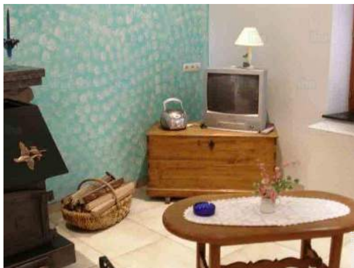
vista dal salone