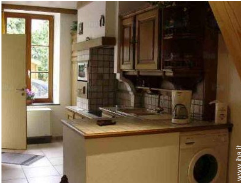
Attrezzature a disposizione