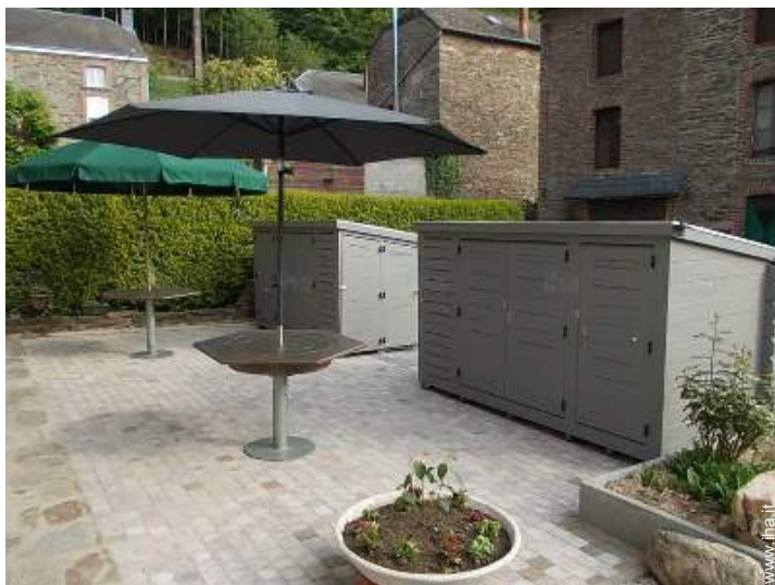
Attrezzature esterne a disposizione degli ospiti