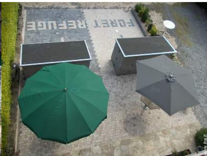
Installazione esterna a disposizione degli ospiti