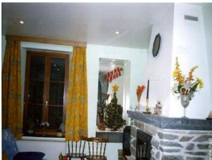
stufa a legna