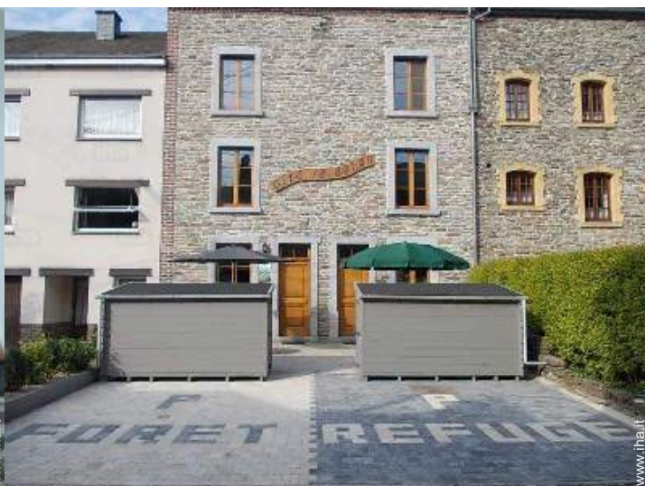
Ambito esterno a disposizione degli ospiti