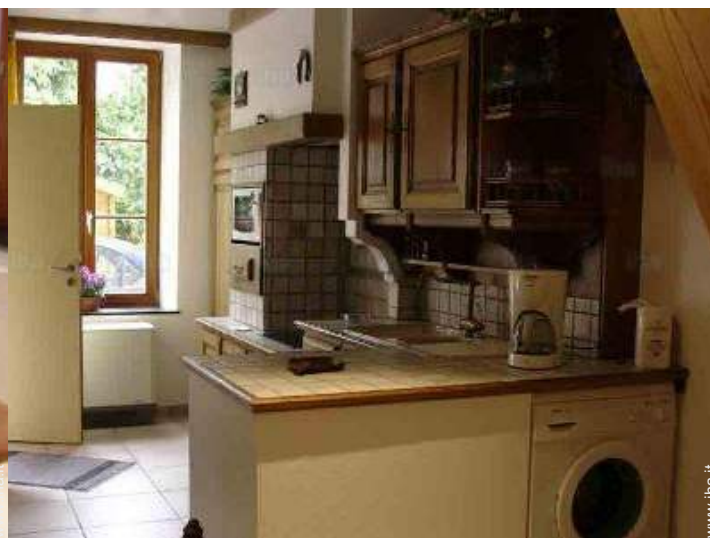
Attrezzature a disposizione