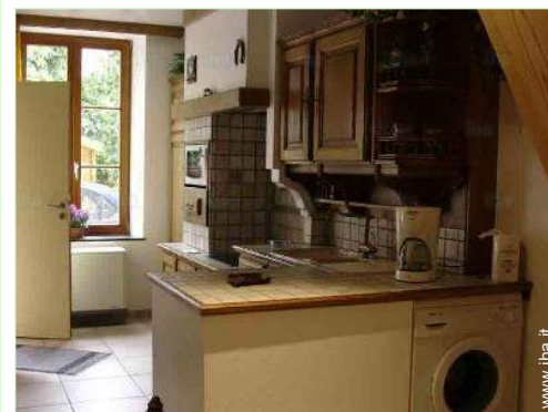
Attrezzature a disposizione

Villaggio centro 200m Fermata/stazionamento bus 200m Noleggio biciclette/mountain bike Panetteria Traiteur Negozi tipici Supermercato Salone di coiffure Ufficio postale Medico