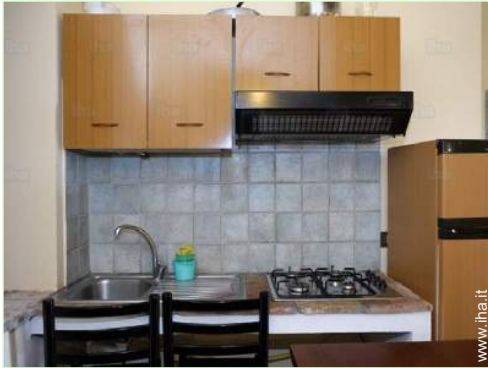
cucina a gas