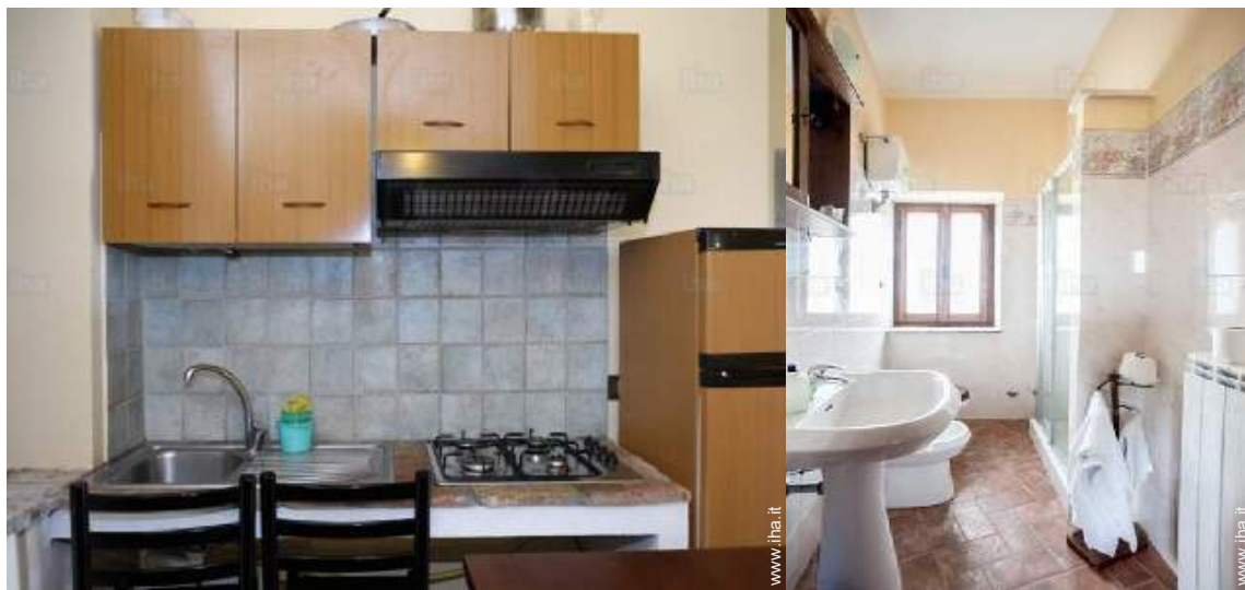
cucina a gas