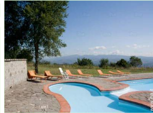
piscina per bambini