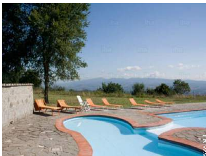
piscina per bambini