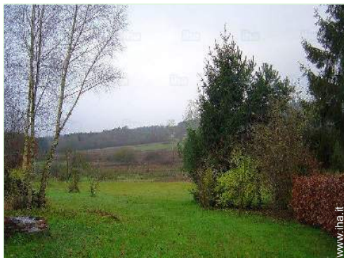
vista dal salone