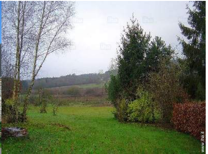
vista dal salone