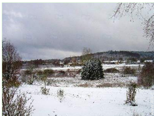
vista dal salone