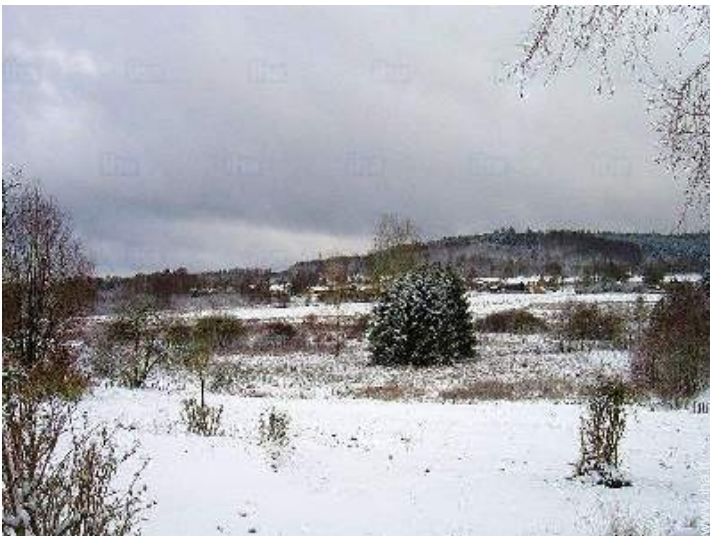
vista dal salone