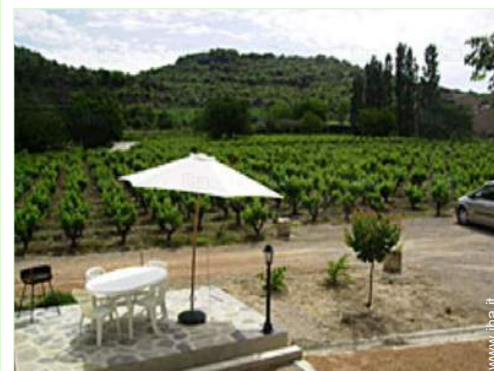
vista dalla proprietà