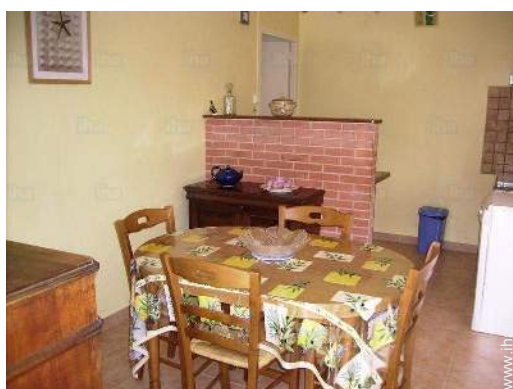
sala da pranzo