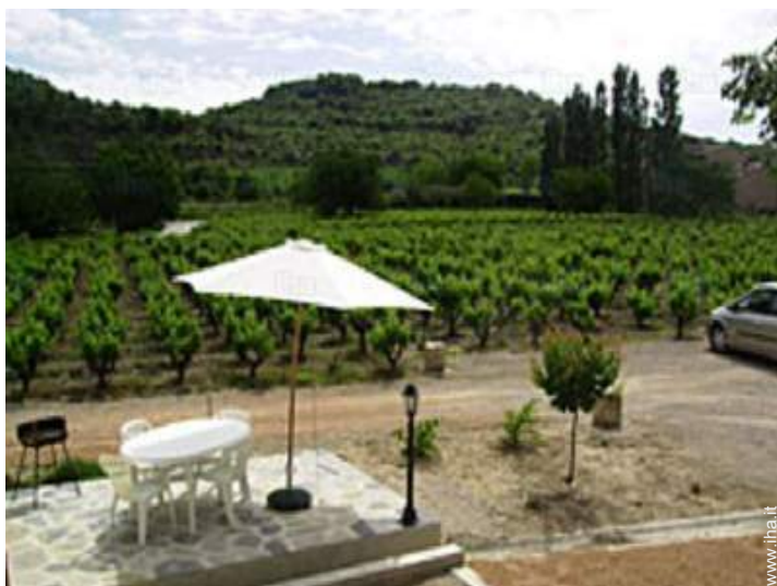
vista dalla proprietà