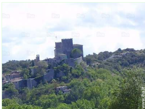
vista dalla casa