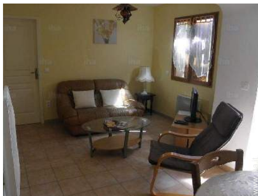
salone con televisore