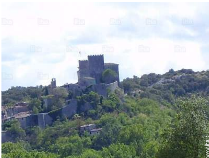
vista dalla casa