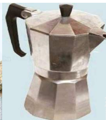
macchina per il caffè espresso