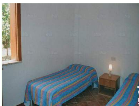
letti gemelli singoli