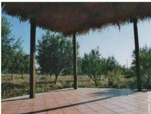
vista dal terrazzo