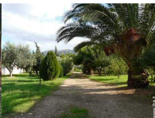
vista sul giardino/parco