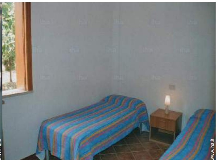
letti gemelli singoli