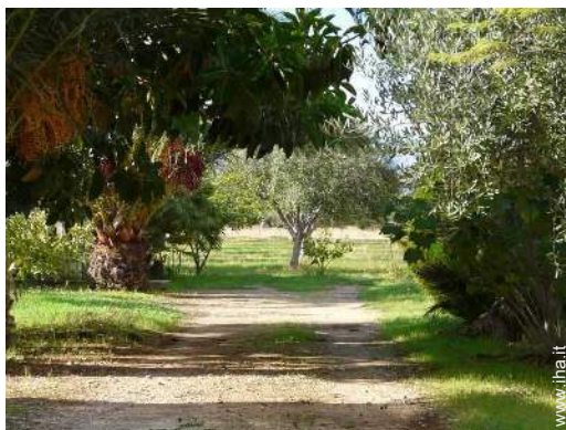
vista sul giardino/parco