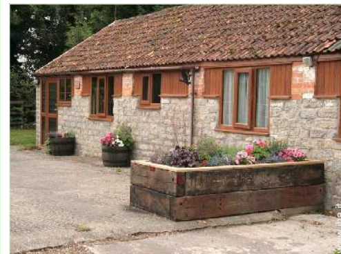
Cottage di Charme