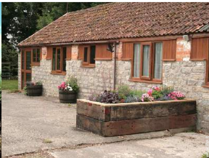
Cottage di Charme