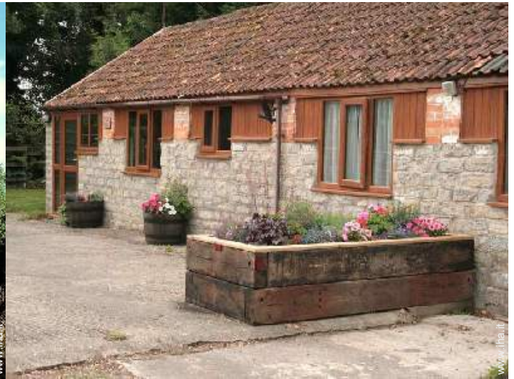
Cottage di Charme