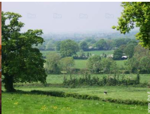
vista sulla campagna