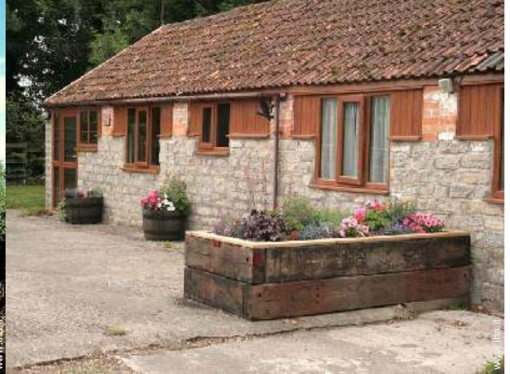
Cottage di Charme