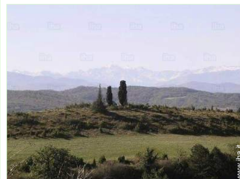
vista dalla casa