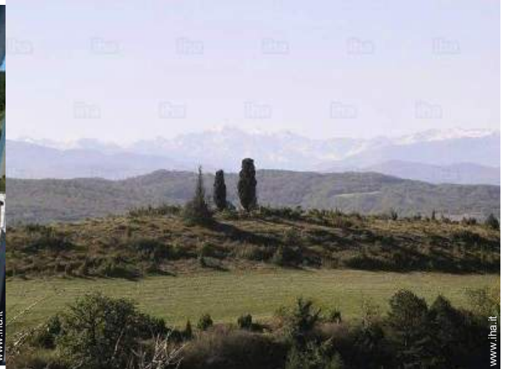
vista dalla casa