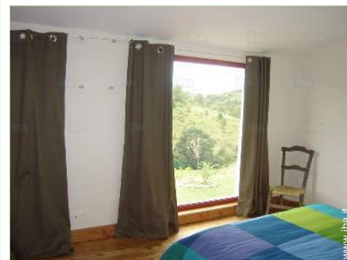
vista dalla camera

Asilo <50m Centro città 7,5km Fermata/stazionamento bus 7,5km Bus navetta piste di sci 7,5km Noleggio biciclette/mountain bike 15km Noleggio auto 7,5km Noleggio attrezzatura di sci 25km Panetteria 7,5km Traiteur 5km Negozi tipici 7,5km Supermercato 7,5km Salone di coiffure 7,5km Ufficio postale 7,5km Banca 7,5km Distributore automatico di biglietti 7,5km Farmacia 7,5km Medico 7,5km Infermiera 7,5km Ospedale 20km