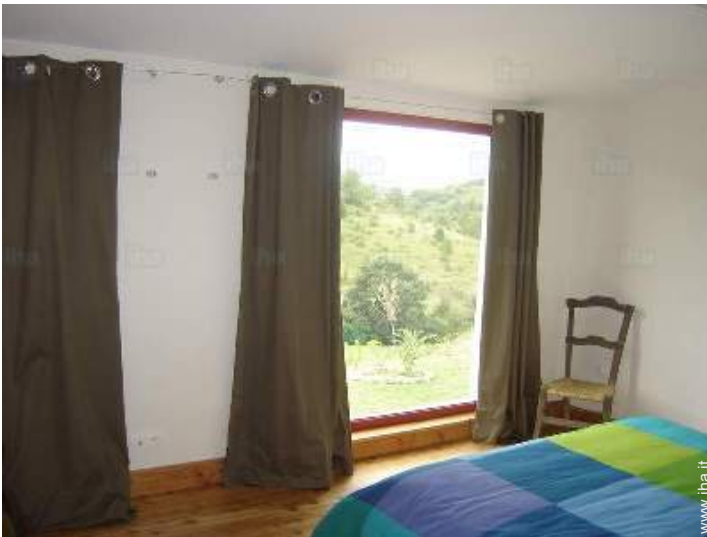
vista dalla camera