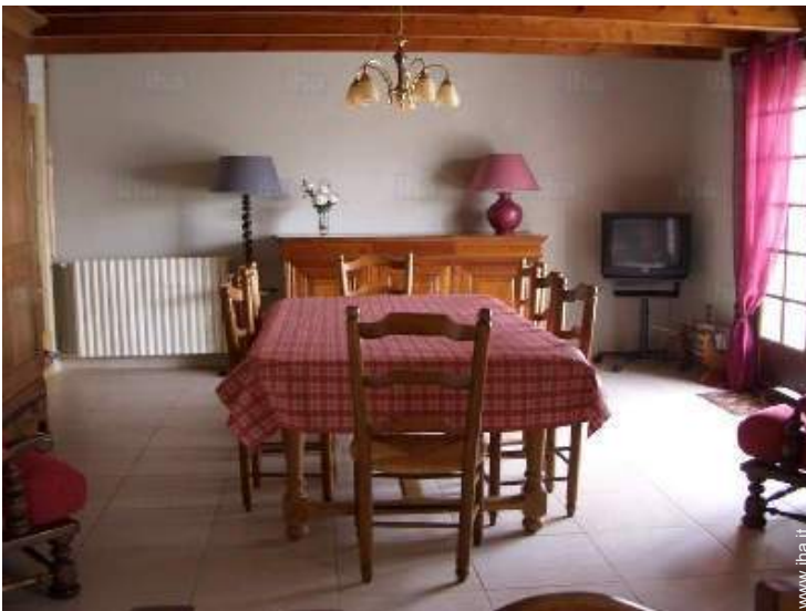
sala da pranzo