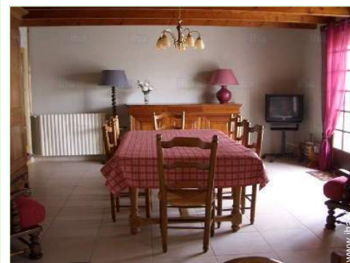
sala da pranzo