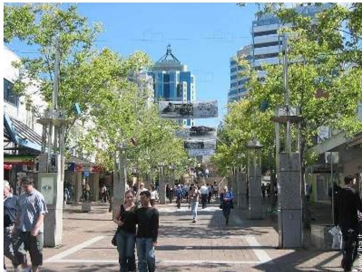
vista sul centro città