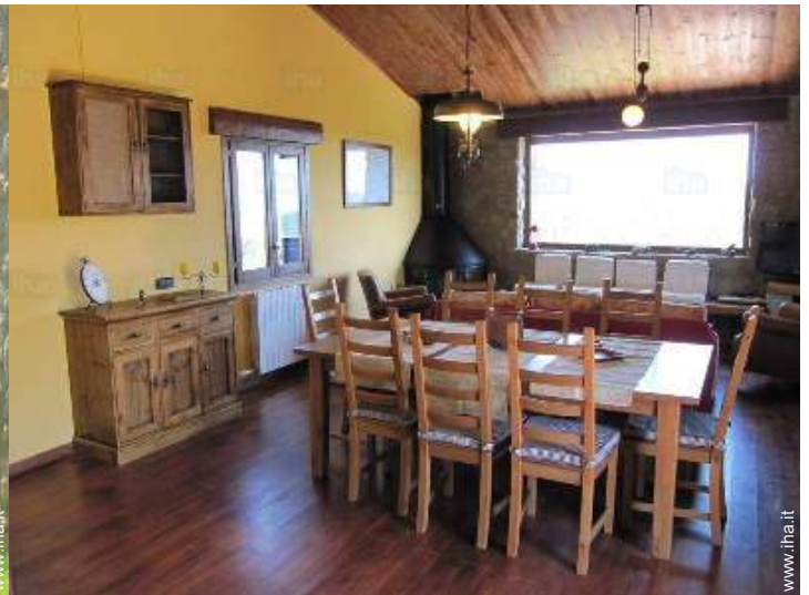
salone con televisore