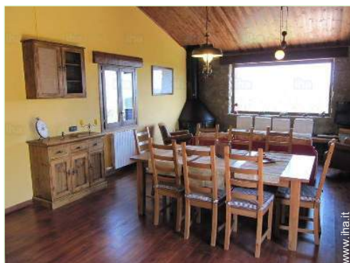
salone con televisore