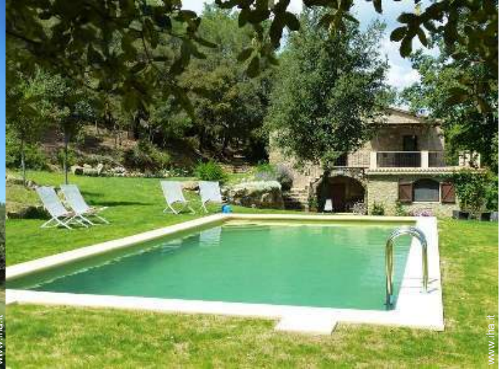
Installazione esterna a disposizione degli ospiti