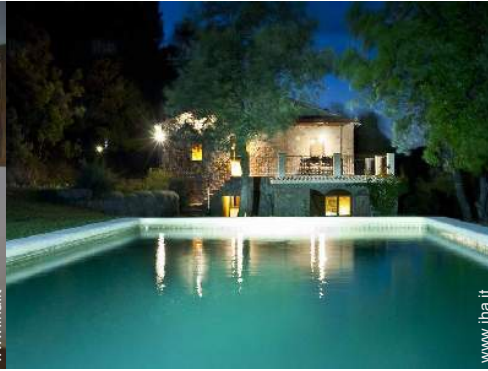
vista dal giardino/parco