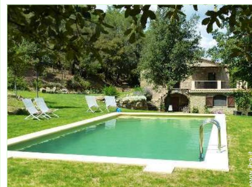
Installazione esterna a disposizione degli ospiti