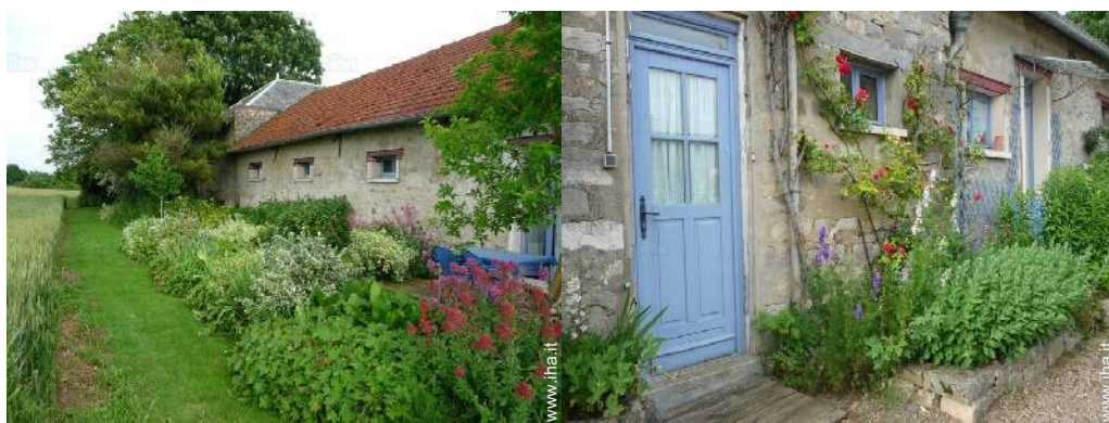
vista dalla camera