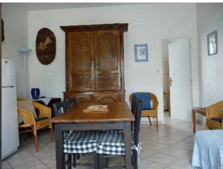
sala da pranzo