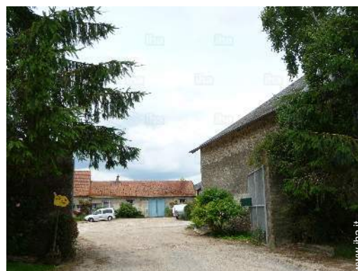
vista sul cortile