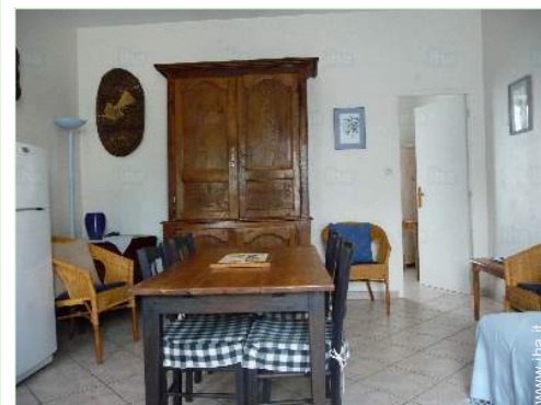
sala da pranzo

Panetteria 4km Traiteur 4km Negozi tipici 4km Supermercato 5km Salone di coiffure 4km Ufficio postale 4km Banca 4km Distributore automatico di biglietti 4km Farmacia 4km Medico 4km Infermiera 4km Ospedale 10km