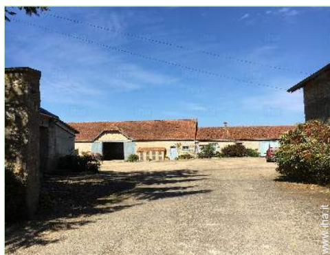
vista sul cortile