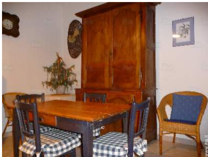
sala da pranzo