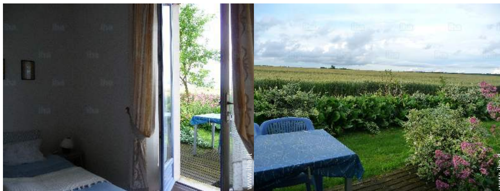
vista dalla camera