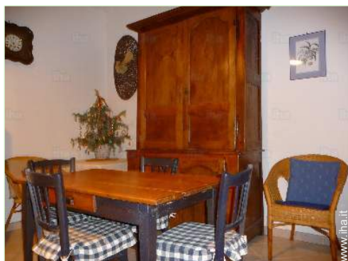
sala da pranzo