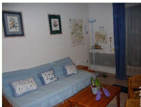
divano(i) letto 2 pers