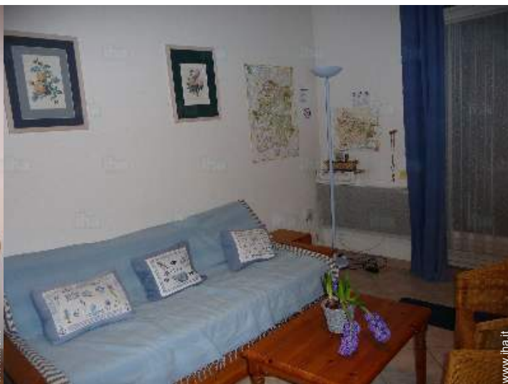
divano(i) letto 2 pers