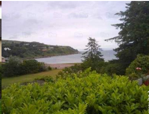
vista dalla casa