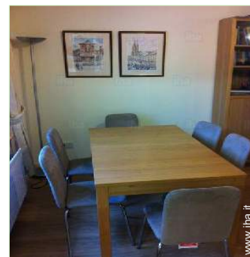
Disposizione interna e comfort

Asilo 500m Villaggio centro 300m Fermata/stazionamento bus <50m Noleggio biciclette/mountain bike 500m Noleggio barche 300m Panetteria 300m Traiteur 200m Negozi tipici 300m Supermercato 300m Salone di coiffure 500m Internet café 300m Ufficio postale 300m Distributore automatico di biglietti 300m Farmacia 500m Medico 500m Infermiera 100m Ambulatorio 500m