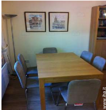
Disposizione interna e comfort