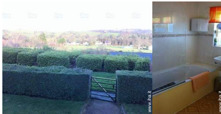
vista dalla proprietà