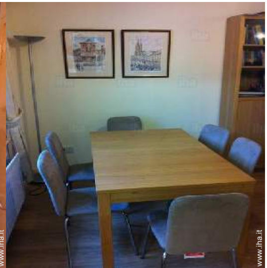
Disposizione interna e comfort