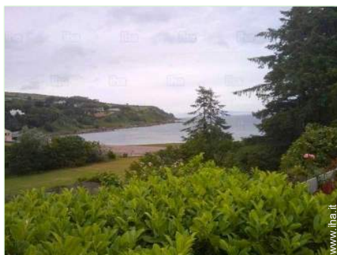
vista dalla casa

Privilegi : Accesso diretto alla spiaggia, green, percorso di golf privato