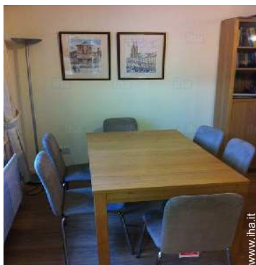
Disposizione interna e comfort