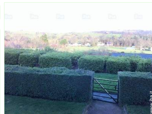
vista dalla proprietà