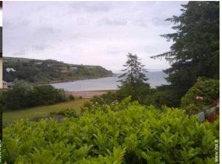
vista dalla casa