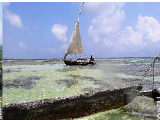
escursione in barca