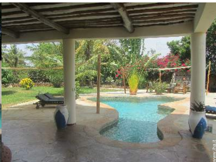
vista dalla piscina