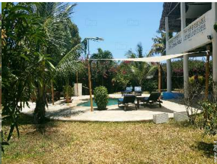
vista sul giardino/parco