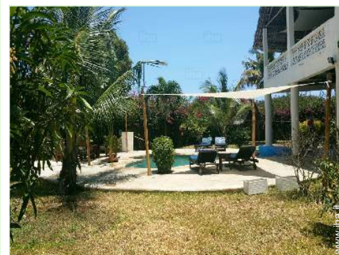
vista sul giardino/parco