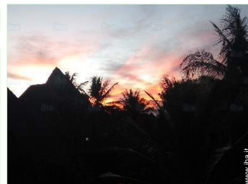
vista dal terrazzo coperto

Barbecue, tavolo da giardino, 6 sedia(e) da giardino, 4 sedia sdraio, 2 amaca(che)