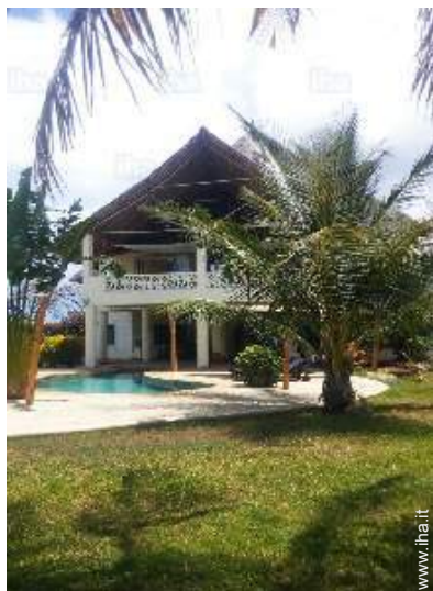
vista sul giardino/parco