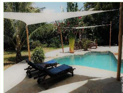
vista dalla piscina

Negozi tipici 500m Supermercato 2km Internet café 4km Banca 7,5km Distributore automatico di biglietti 7,5km Farmacia 5km Medico 4km Ospedale 10km