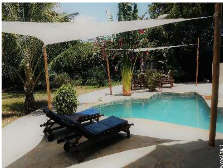
vista dalla piscina