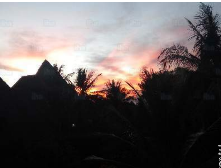
vista dal terrazzo coperto