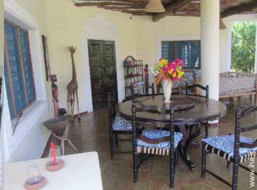
vista dal terrazzo coperto