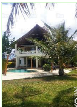
vista sul giardino/parco