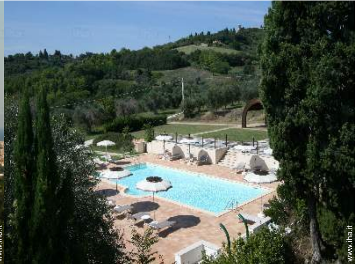
piscina in comune