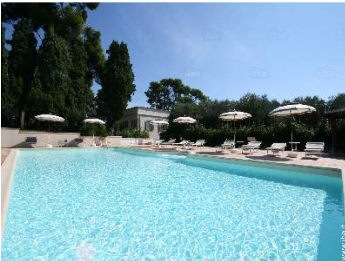
piscina in comune