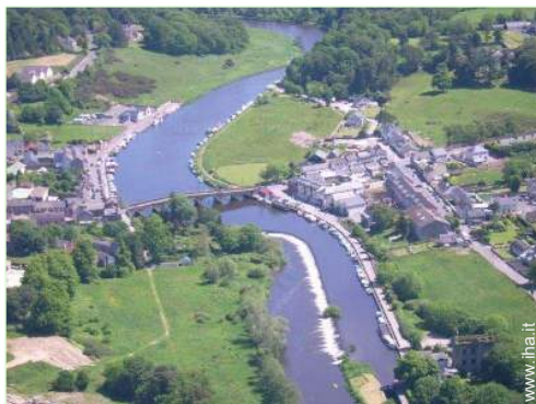
vista sul fiume