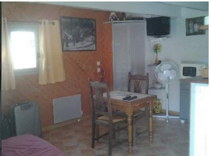
Disposizione interna e comfort