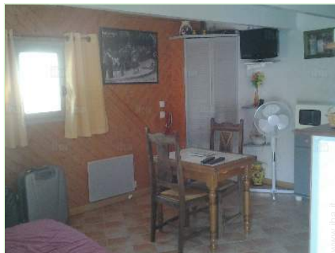
Disposizione interna e comfort