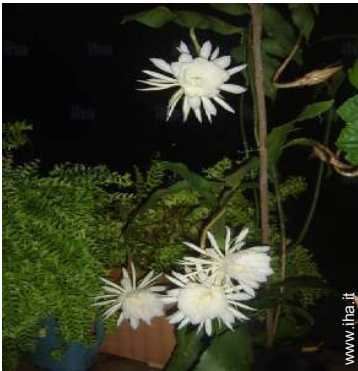
vista dal terrazzo coperto