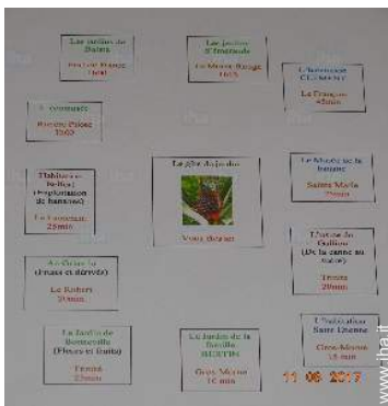
parco e giardino