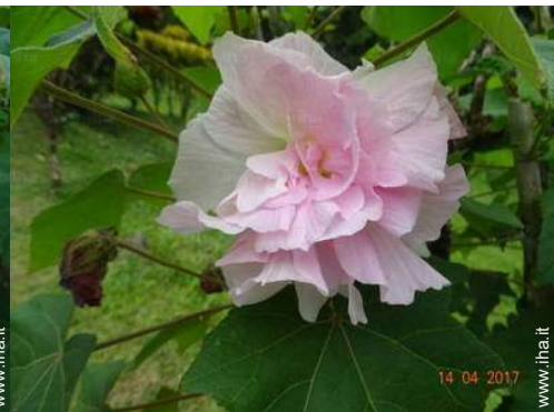
vista dal terrazzo coperto