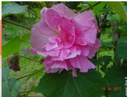
vista dal terrazzo coperto