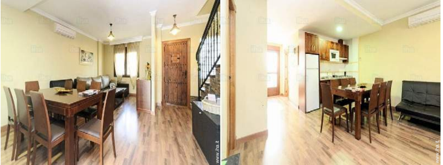
Comfort interno ed attrezzature