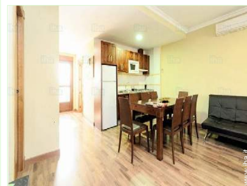
Comfort interno ed attrezzature