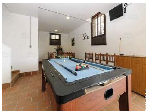
tavolo da biliardo