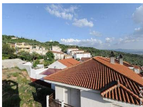
vista sulla campagna