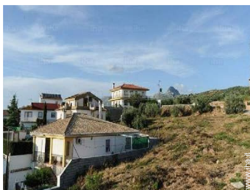
vista dalla casa