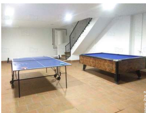
tavolo da ping-pong