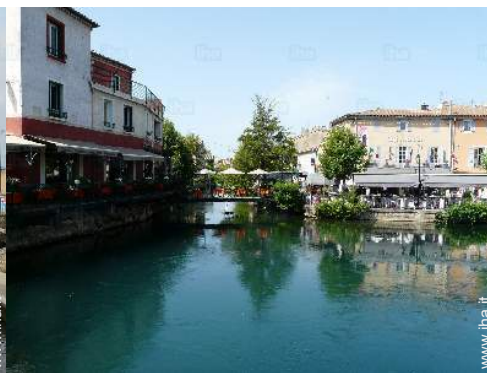
vista sulla città