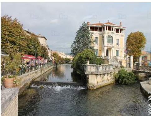
vista sul centro città