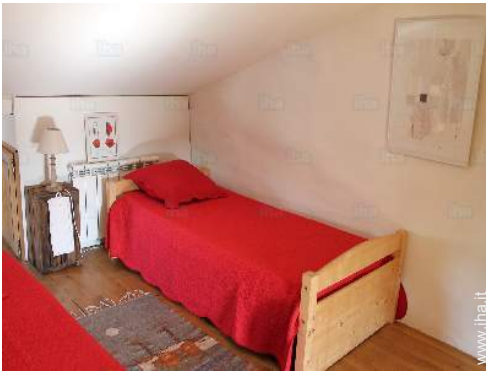
letti gemelli singoli