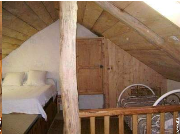
vista dal mezzanino