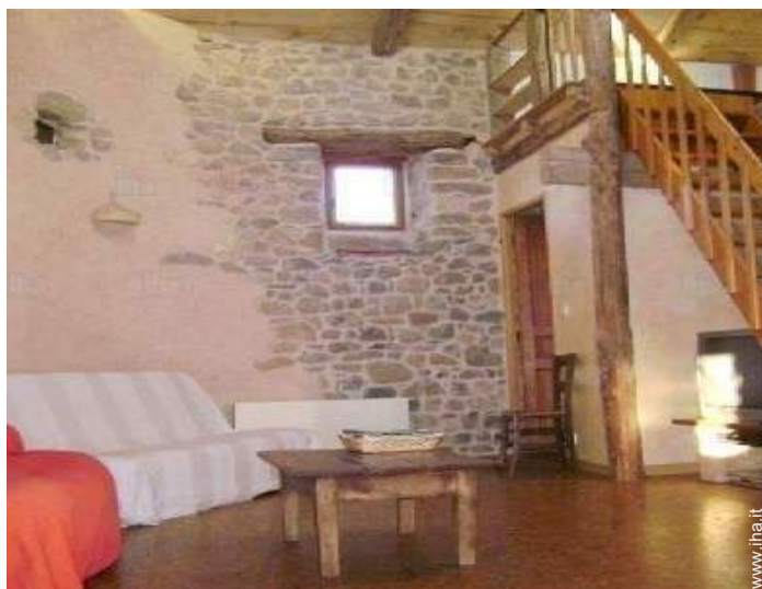
vista dal soggiorno