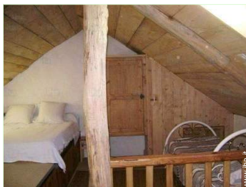
vista dal mezzanino