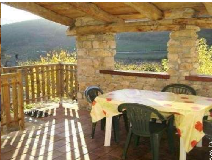
vista dal terrazzo coperto