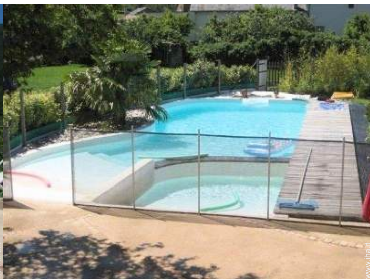
vista dalla piscina