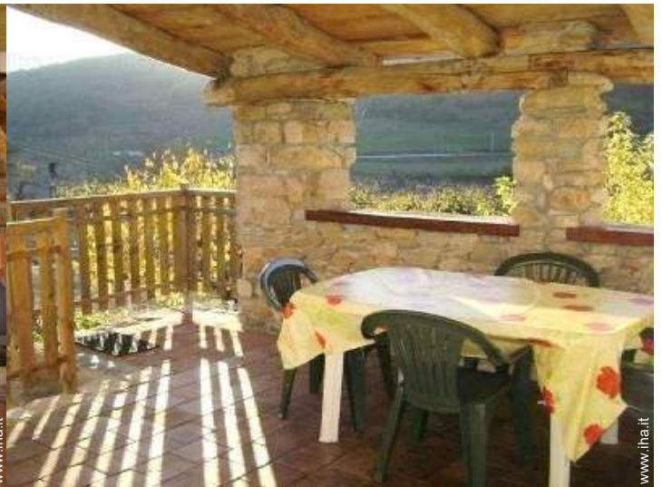
vista dal terrazzo coperto