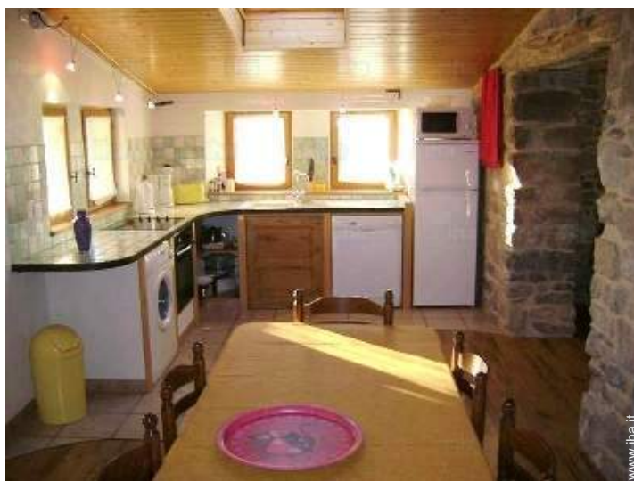
vista dalla cucina