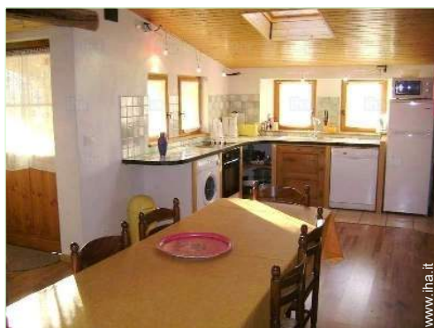
vista dalla cucina