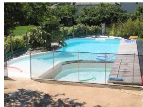
vista dalla piscina

Villaggio centro 200m Centro città 10km Fermata/stazionamento bus 7,5km Panetteria 1,5km Negozi tipici 2km Supermercato 10km Negozi di alta classe e di lusso 10km Salone di coiffure 4km Internet café 10km Ufficio postale 2km Banca 10km Distributore automatico di biglietti 2km Farmacia 5km Medico 7,5km Infermiera 5km Ospedale 10km