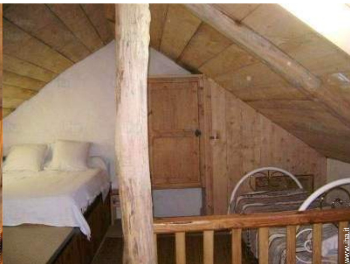
vista dal mezzanino