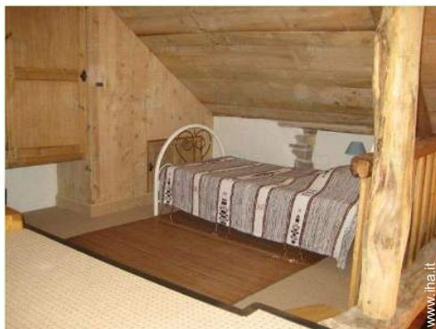
vista dal mezzanino