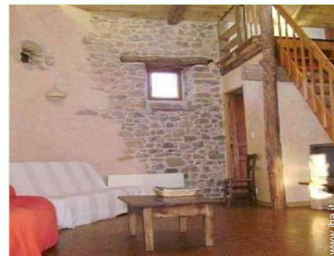
vista dal soggiorno