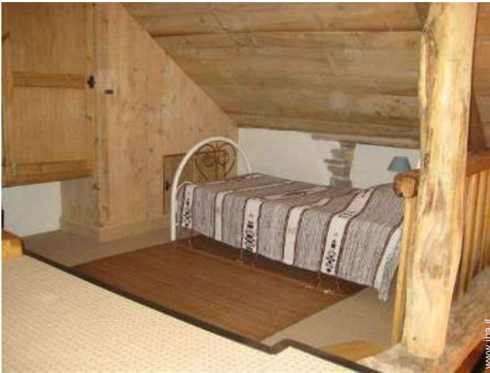
vista dal mezzanino