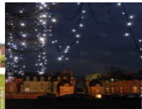
vista sul monumento