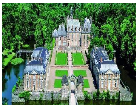
Appartamento di terreno