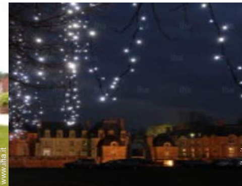
vista sul monumento