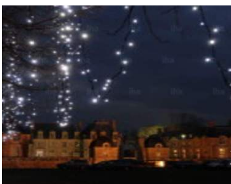
vista sul monumento