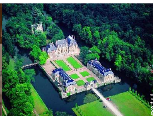
Appartamento di terreno