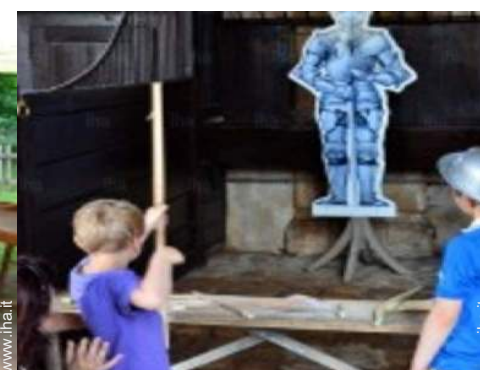
attrezzature ricreative nelle vicinanze