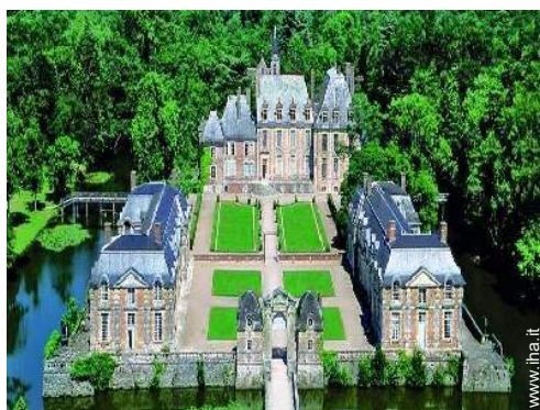
Appartamento di terreno