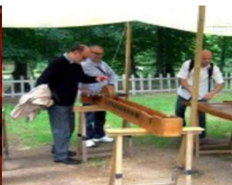
attrezzature ricreative nelle vicinanze