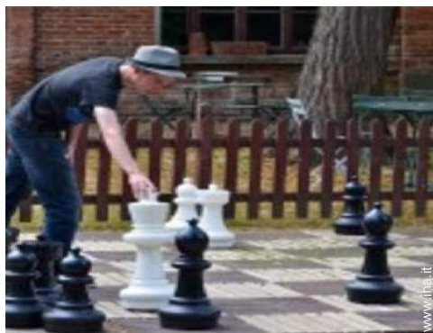
attrezzature ricreative nelle vicinanze