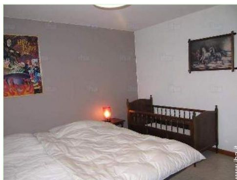
letto (i) bambino