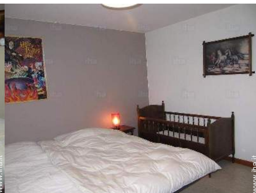
letto (i) bambino