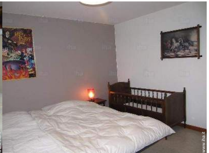
letto (i) bambino