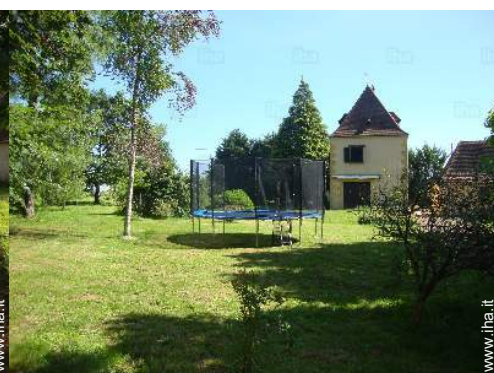
Attrezzature esterne a disposizione degli ospiti