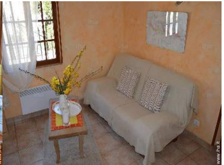
divano(i) letto 2 pers