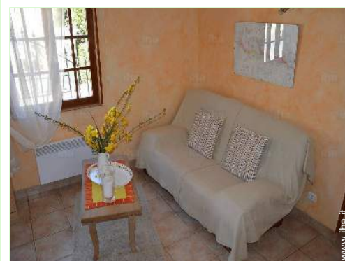
divano(i) letto 2 pers

Centro città 3km Noleggio biciclette/mountain bike 7,5km Panetteria 3km Traiteur 7,5km Negozi tipici 3km Supermercato 7,5km Ufficio postale 3km Banca 7,5km Distributore automatico di biglietti 7,5km Farmacia 3km Medico 3km Infermiera 3km Ospedale 7,5km