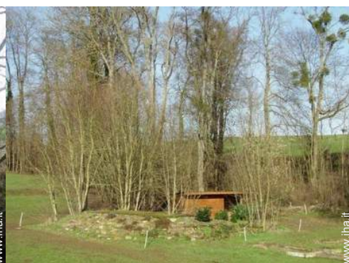
vista dal salone