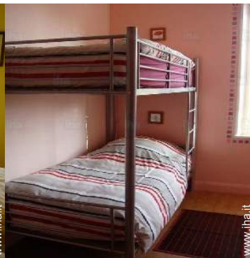
camera dei bambini