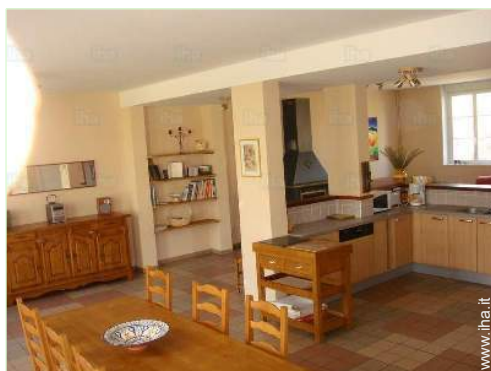
cucina in stile americano