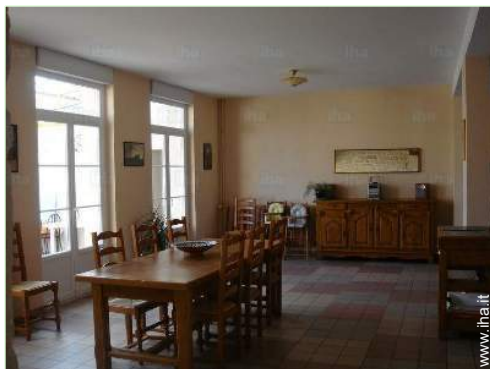
sala da pranzo