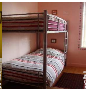
camera dei bambini