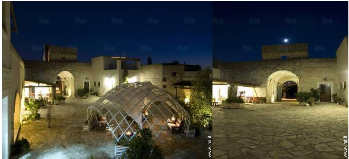
vista sul cortile