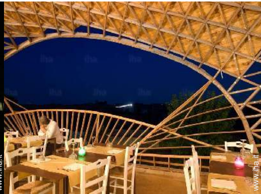
vista dal terrazzo