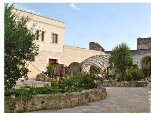
vista sul cortile