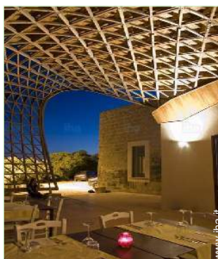
vista dal terrazzo