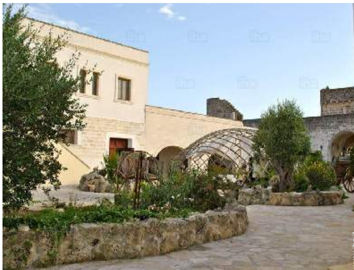
vista sul cortile