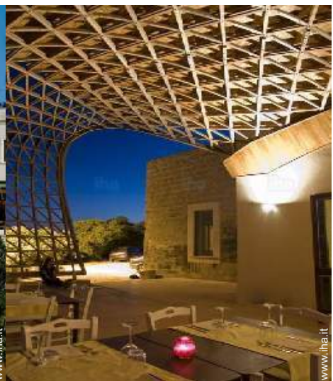
vista dal terrazzo