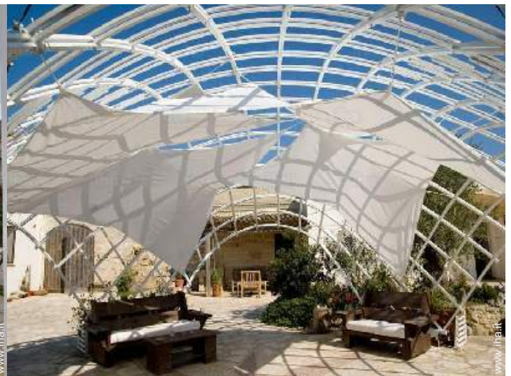
vista sul cortile