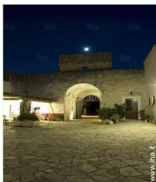
vista sul cortile