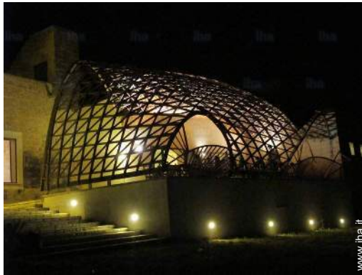
vista dal terrazzo