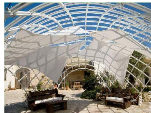
vista sul cortile