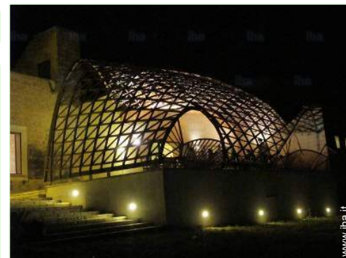
vista dal terrazzo