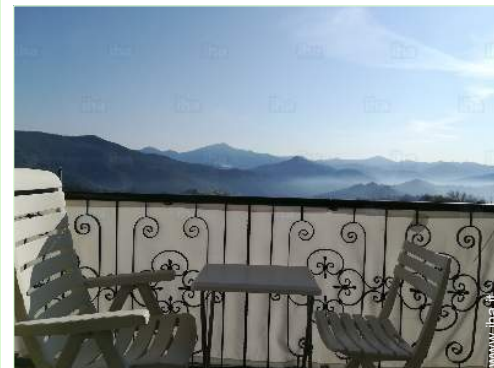
vista dalla proprietà