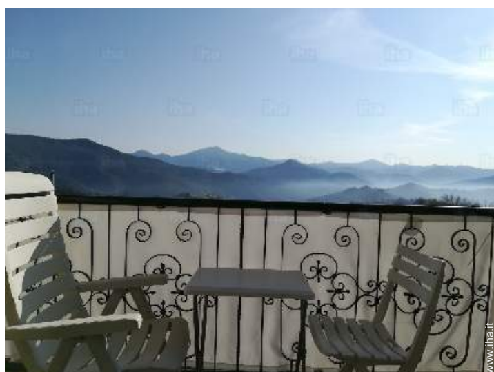
vista dalla proprietà