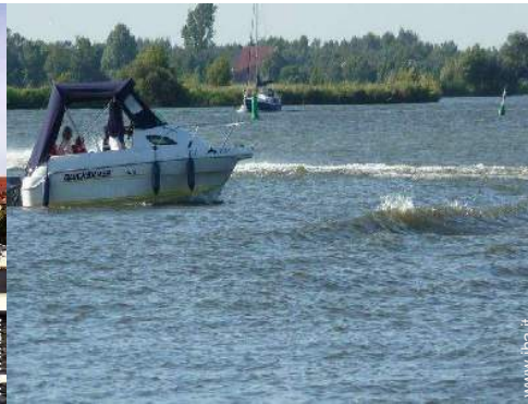
escursione in barca