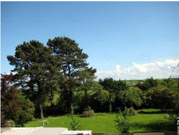
vista sulla campagna