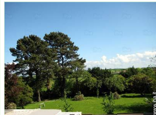
vista sulla campagna