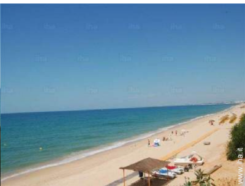
punto di windsurf