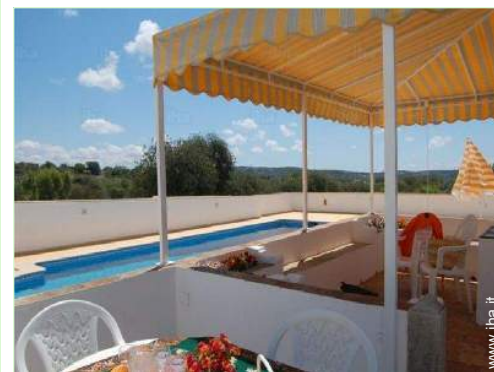
Installazione esterna a disposizione degli ospiti

Centro città 4km Supermercato 2km Salone di coiffure 4km Internet café 4km Ufficio postale 4km Banca 4km Distributore automatico di biglietti 4km Farmacia 4km Medico 4km Ospedale 4km Ambulatorio 4km