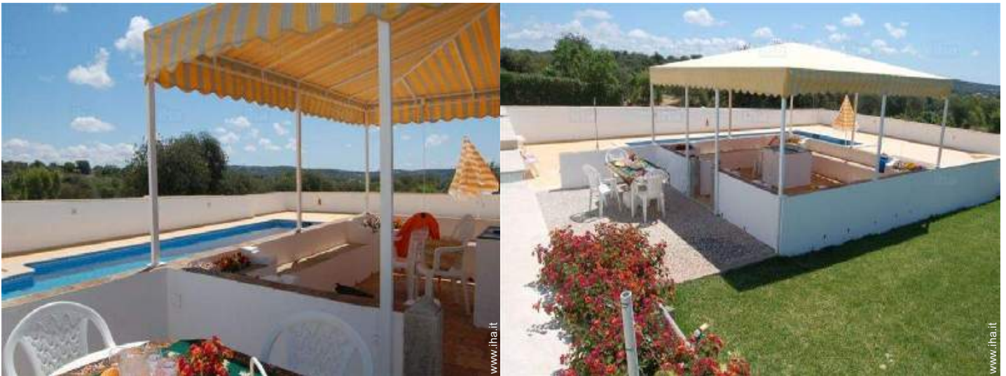
Installazione esterna a disposizione degli ospiti