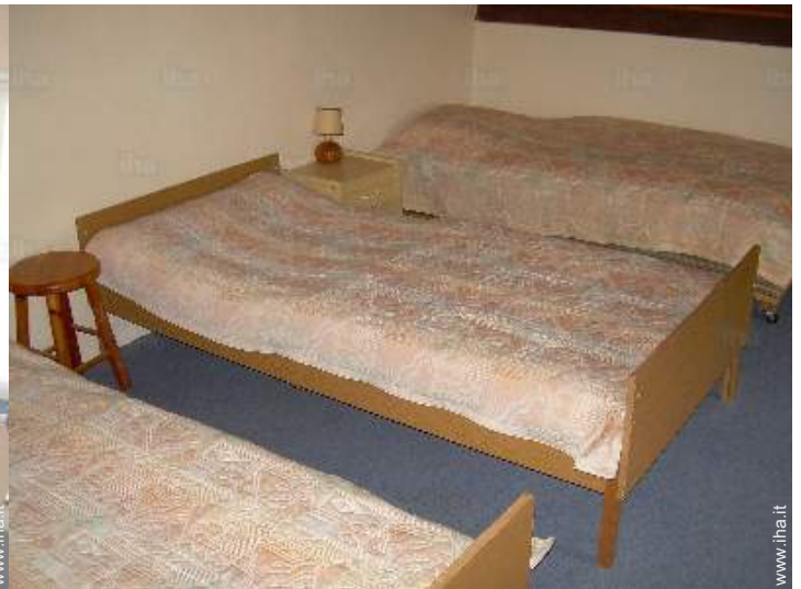
camera per ragazzi