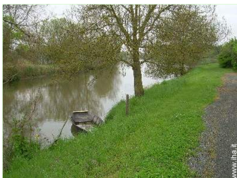
vista sul fiume