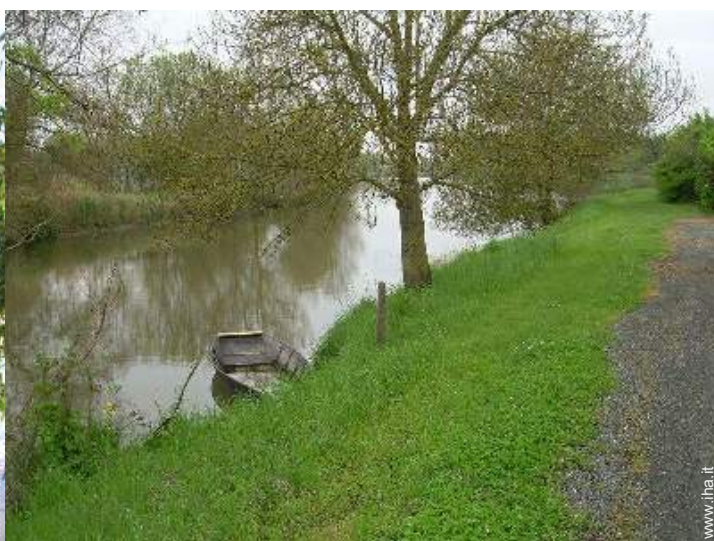
vista sul fiume