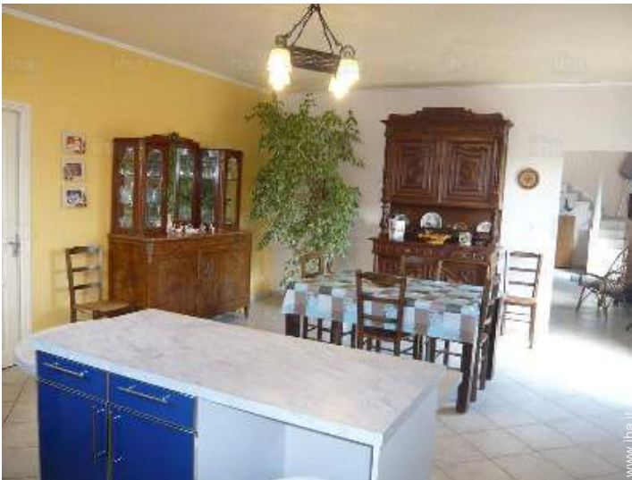
grande cucina indipendente