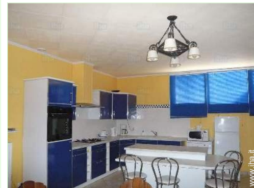
grande cucina indipendente

Villaggio centro <50m Panetteria <50m Traiteur <50m Negozi tipici <50m Supermercato 7,5km Negozi di alta classe e di lusso 25km Salone di coiffure <50m Ufficio postale <50m Banca <50m Distributore automatico di biglietti <50m Farmacia <50m Medico <50m Infermiera <50m Ospedale 15km