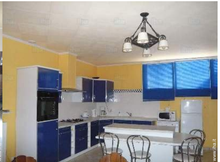
grande cucina indipendente