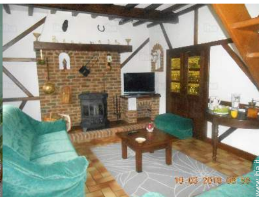
salone con televisore