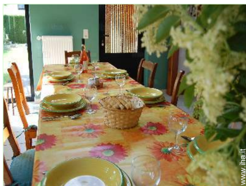
sala da pranzo