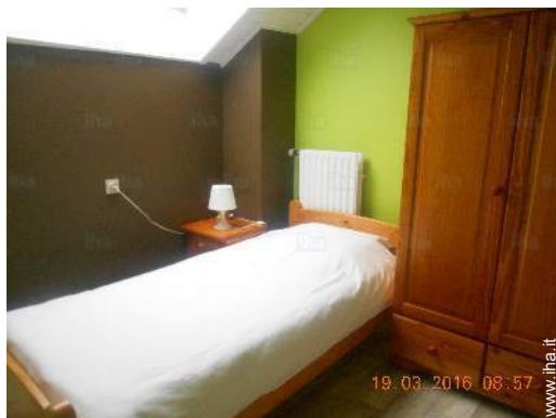
camera dei bambini