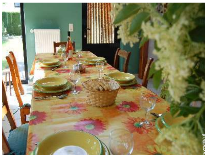
sala da pranzo