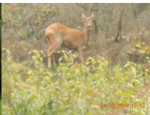
vista dal giardino/parco