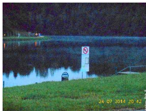
attività balneari nelle vicinanze