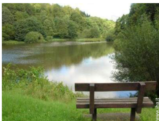
attrezzature ricreative nelle vicinanze