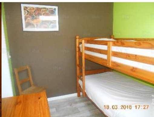
camera dei bambini