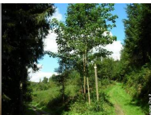
attrezzature ricreative nelle vicinanze