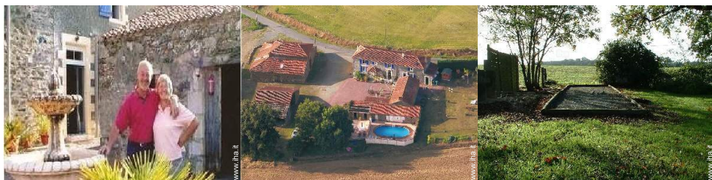
I vostri ospiti