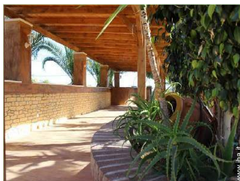
Attrezzature a disposizione