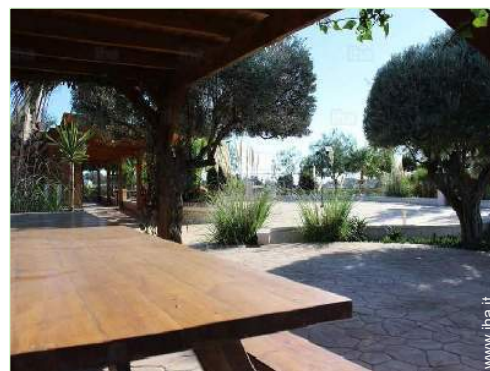
Attrezzature a disposizione