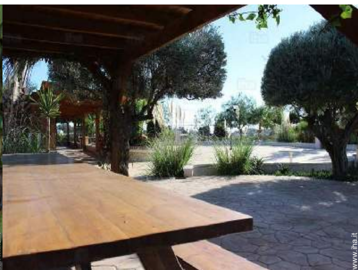
Attrezzature a disposizione