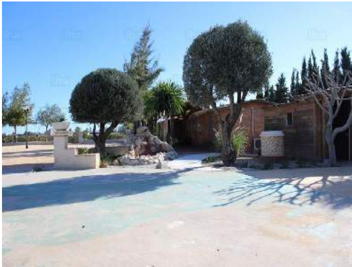
Attrezzature a disposizione