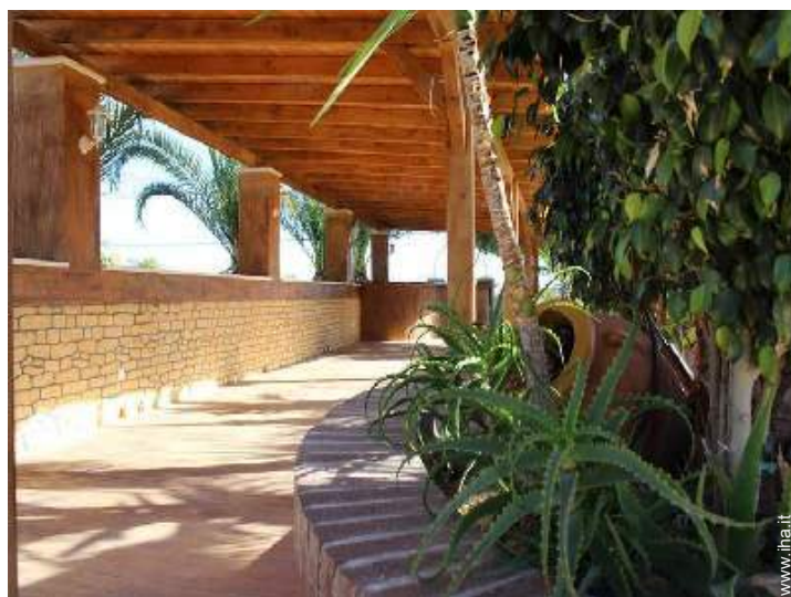
Attrezzature a disposizione