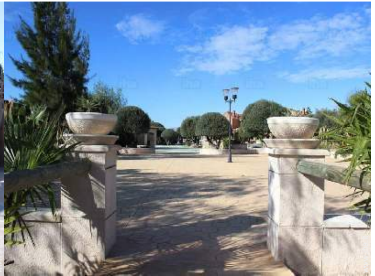
Attrezzature a disposizione