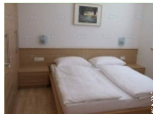
vista dalla camera