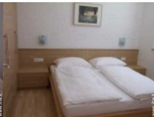
vista dalla camera