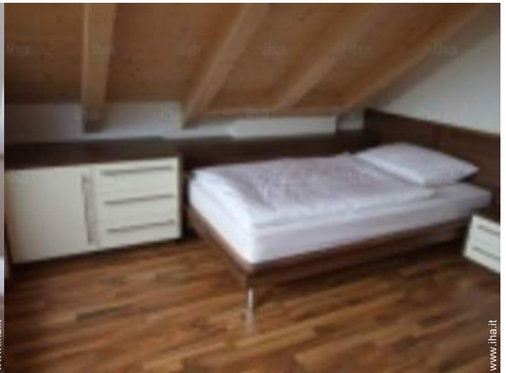
vista dalla camera