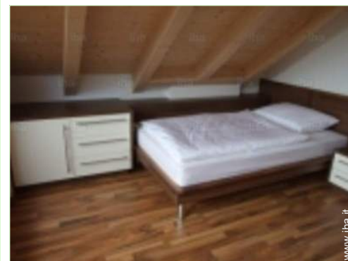
vista dalla camera

Fermata/stazionamento bus Supermercato Banca