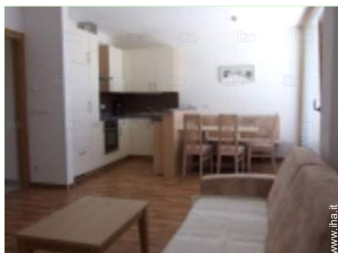
vista dalla cucina