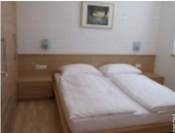
vista dalla camera