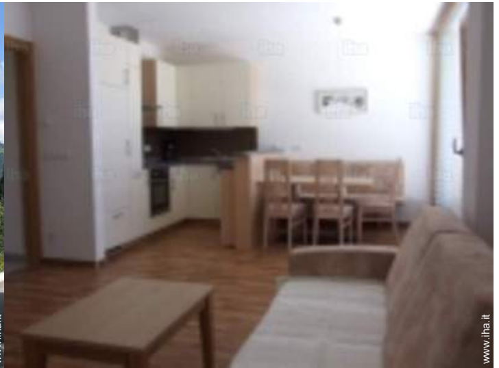
vista dalla cucina