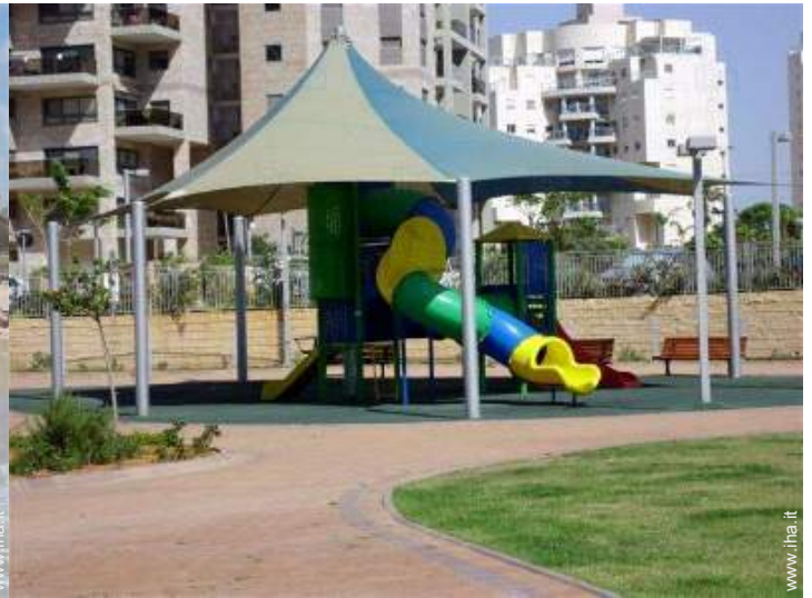
disposizione delle attrezzature ricreative