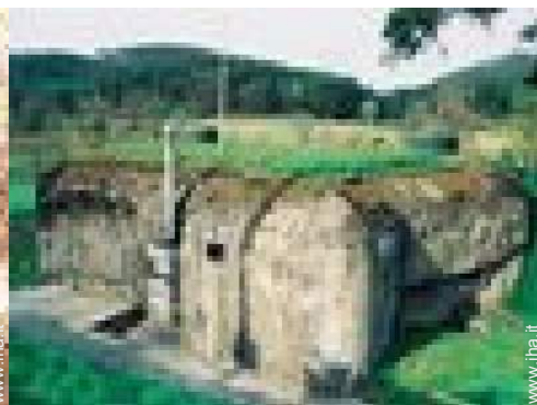
Presenza sul posto