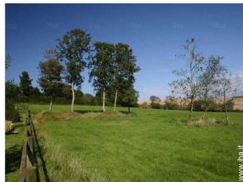
vista sul prato

Barbecue, tavolo da giardino, altalena, struttura rampicante per bambini