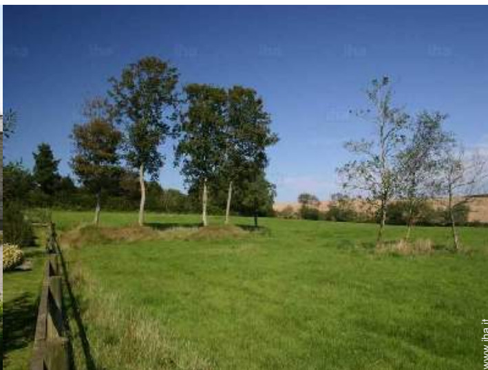
vista sul prato