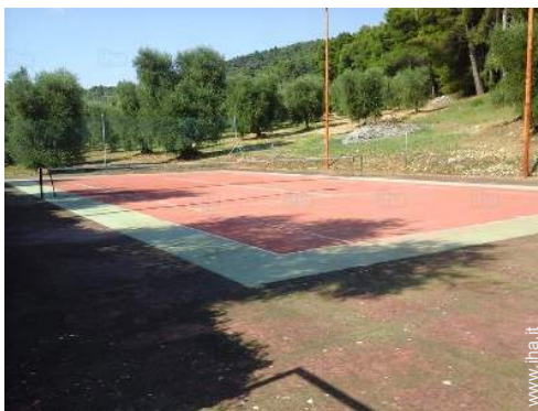
campo da tennis privato