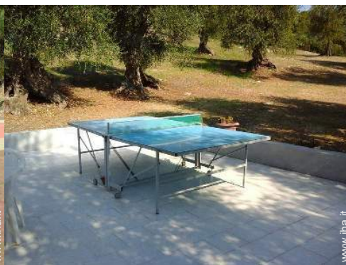
tavolo da ping-pong