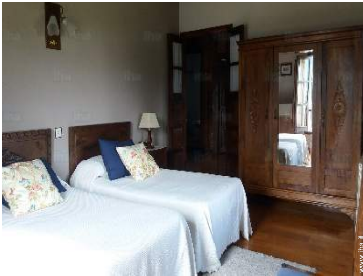
letti gemelli singoli