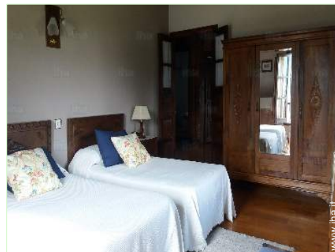
letti gemelli singoli

Barbecue, tavolo da giardino, sedia(e) da giardino, salotto da giardino, struttura rampicante per bambini