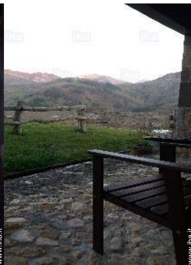
vista dalla casa