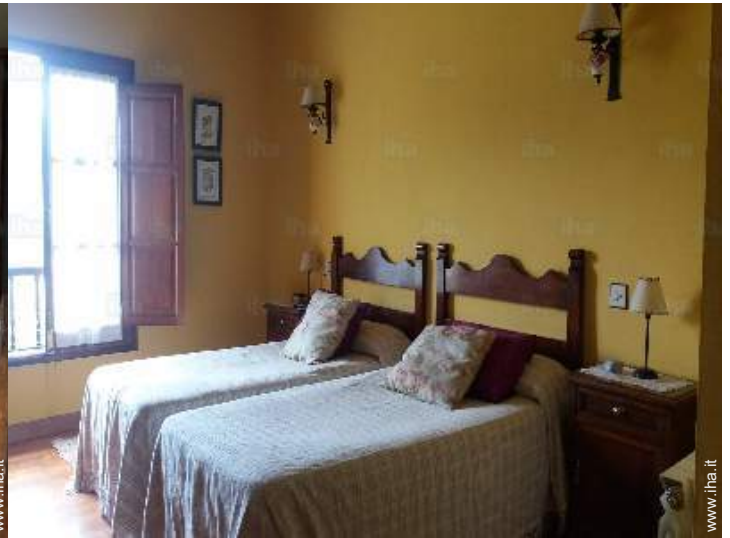
letti gemelli singoli