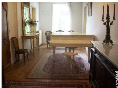
sala di musica