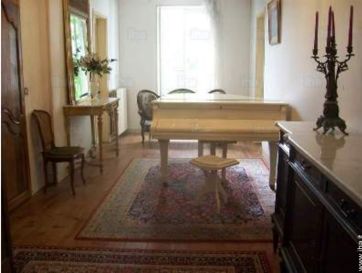
sala di musica